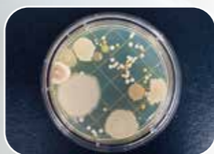
浮遊カビ菌培養サンプル