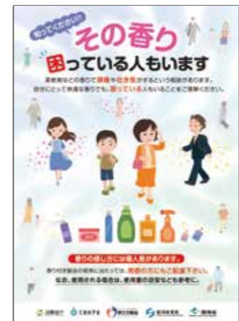
各省庁よりニオイ問題の啓発がされています