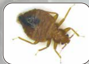
厚生労働省資料引用