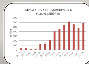
厚生労働省資料引用

*ヤケヒョウダニ 試験番号 20223037467-1 *トコジラミ 報告番号 E25-031 *ヤクモ 報告番号 E25-030