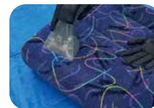
リンサークリーナー