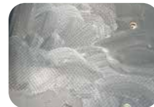
床面ブラッシング