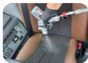
専用機器による防カビ加工